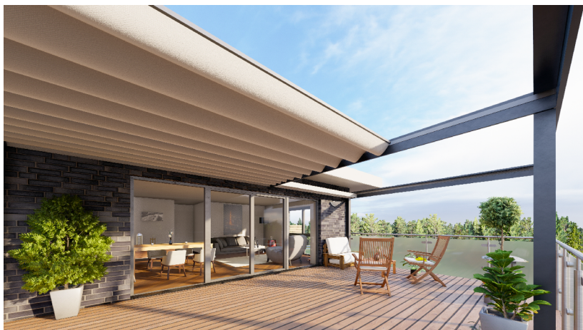
Farbliche Abweichungen möglich!